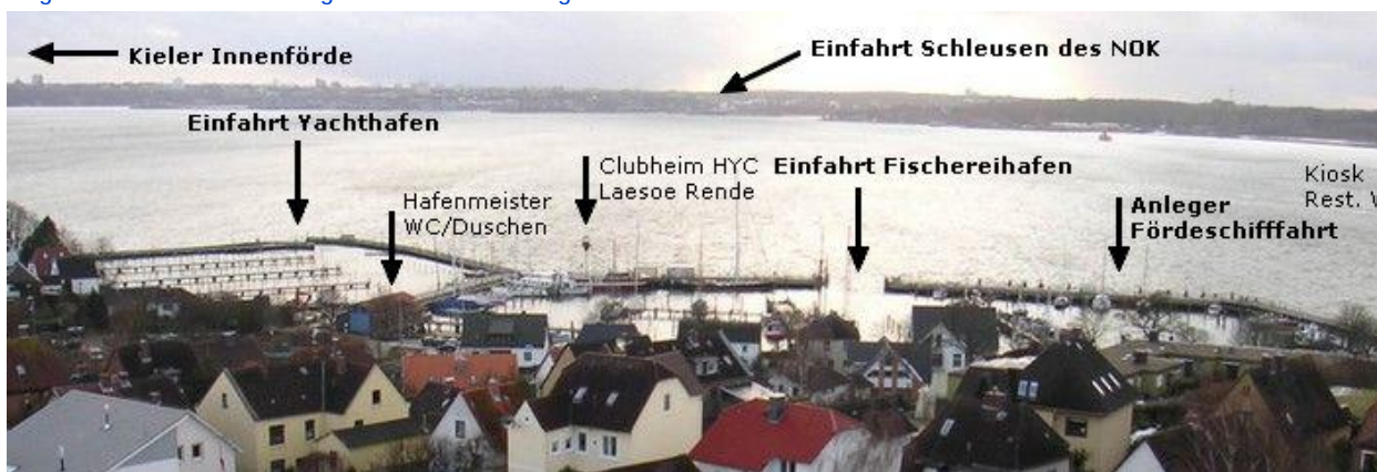
Fahrregeln für Wassersportler auf der Kieler Förde

Der Hafen Heikendorf - Möltenort ist ein maritimes Kleinod auf der Ostseite - der Sonnenseite - der Kieler Förde. Er teilt sich auf Yachthafen mit rund 200 Liegeplätzen und dem Fischereihafen mit rund 110 Liegeplätzen, hat eine Wassertiefe bis zu 4 Meter und allen wünschenswerten Hafen-Facilitäten versehen. Kleinere, mittlere und zum Teil große Yachten, Segel-, Motor- und Fischerboote Original-Dänische Feuerschiff geben in ihrer Mischung dem Hafen seinen besonderen maritimen Charakter.