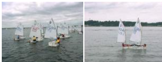
Optimisten der Jugendabteilung

Internet: www.hyc86.de Mail: info@hyc86.de