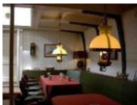
Der maritim-gemütliche Salon