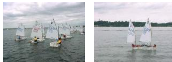
Optimisten der Jugendabteilung

Internet: www.hyc86.de Mail: info@hyc86.de