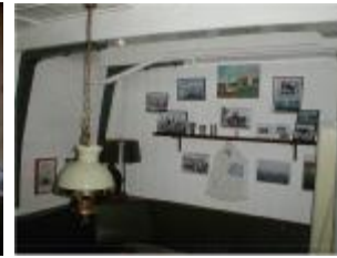
Erfolge unserer Jugendabteilung