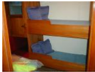
Die rustikalen Køjen