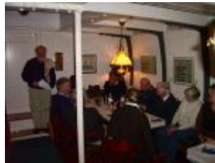
Backen & Banken im Winter