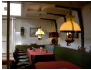
Der maritim-gemütliche Salon