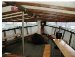
Der geräumige Vorschiffsbereich mit Fördeblick