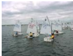
Optimisten der Jugendabteilung