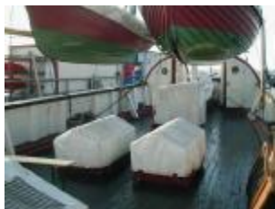
Blick auf's Achterdeck